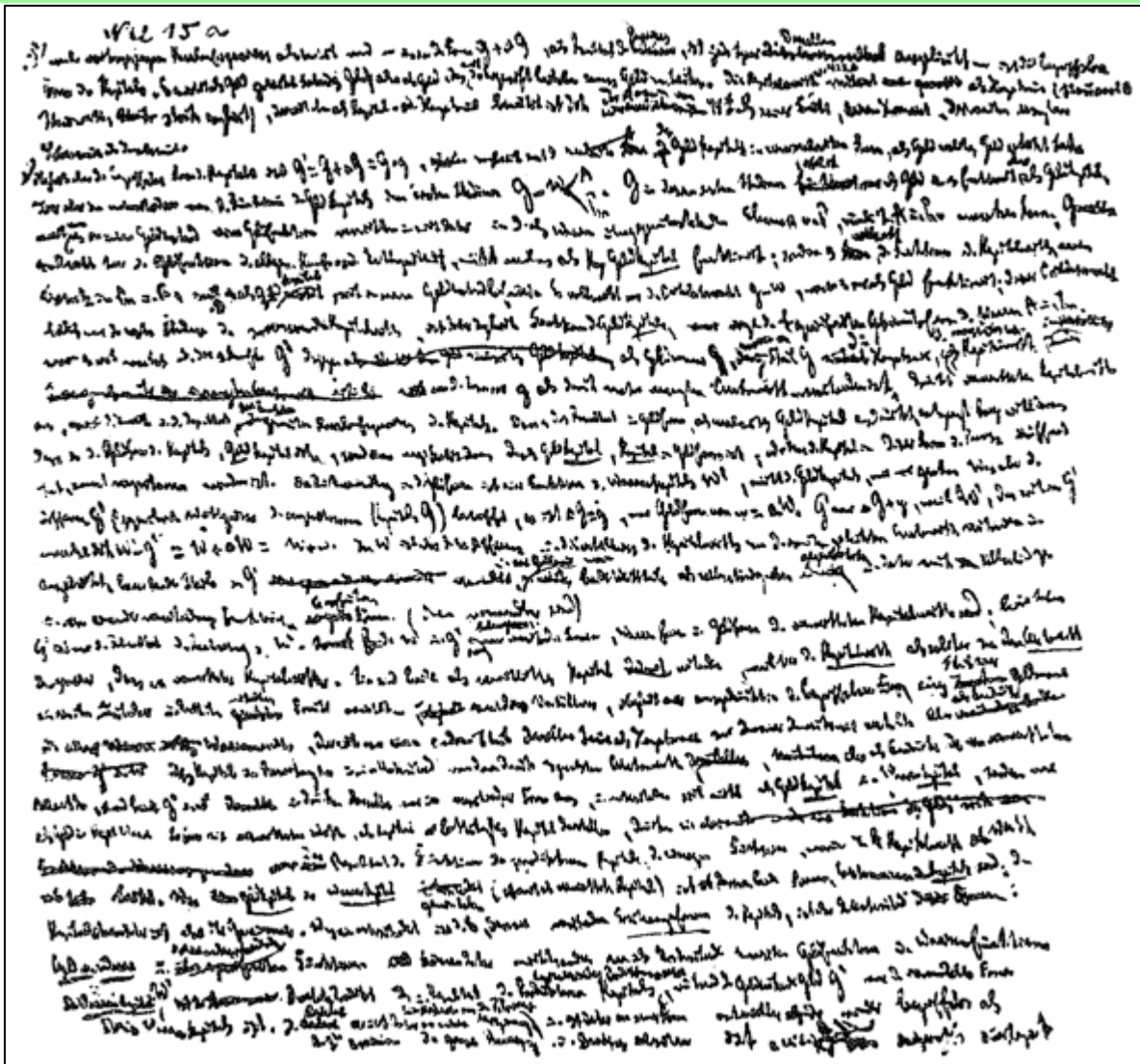
Факсимиле на ръкописа от II том на "Капиталът" на Карл Маркс

Обръщението на капитала се извършва нормално само докато неговите различни фази без задръжки преминават една в друга. Ако капиталът спре в първа фаза II—C , то паричният капитал застива като съкровище; ако това става в производствената фаза — то на едната страна лежат средствата за производство, без да функционират, докато на другата страна работната сила остава незаета; ако това стане в последната фаза C'—II' , то натрупаните непродадени стоки преграждат потока на обръщението.